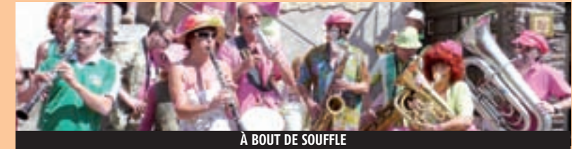
À BOUT DE SOUFFLE

ACCÈS LIBRE, À L'EXCEPTION DU CONCERT DE CLÔTURE LE SAMEDI 25