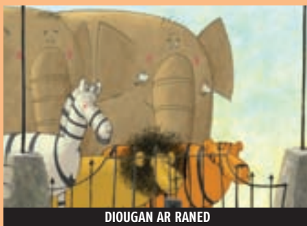
DIUGAN AR RANED